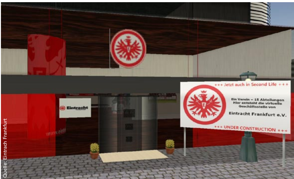
Eintracht Frankfurt ist der erste Bundesliga-Verein in Second Life. Sein Auftritt befindet sich derzeit im Aufbau. Hier ein erster Eindruck, noch vor der offiziellen Vorstellung des virtuellen Treffpunkts für Eintracht-Fans.